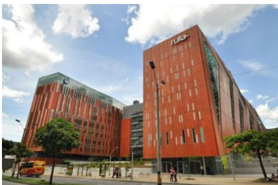
Instalaciones Ruta N.

Medellín tiene hoy en día uno de los ecosistemas de innovación más envidiados en América Latina. El premio recibido como “ciudad más innovadora” la puso en la mira de muchos países que han manifestado interés en conocer sus buenas prácticas. Este logro tan importante se debe, en gran parte, a uno de sus actores más representativos: Ruta N.