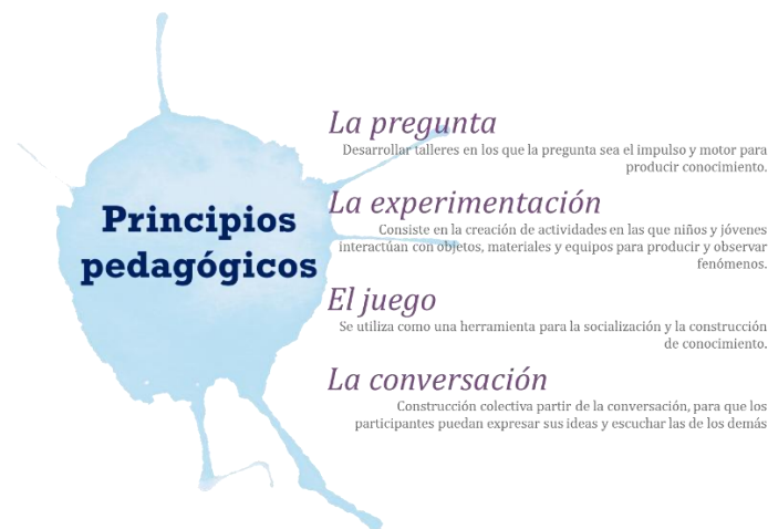
Esquema 2. Principios pedagógicos de la Universidad de los niños EAFIT