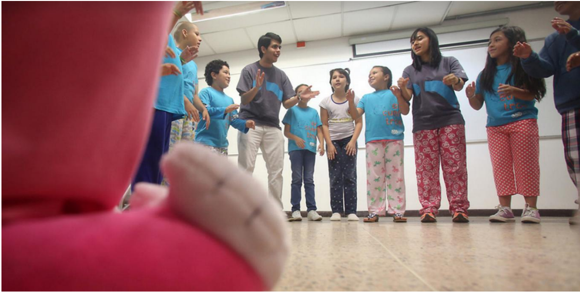
Por medio de un juego se inicia el taller ¿Qué nos pasa mientras dormimos? , los niños activan las baterías que utilizarán durante el día.