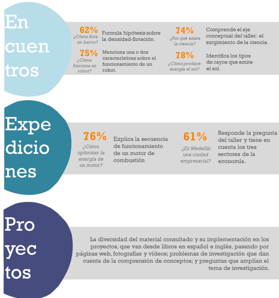
Esquema 3. Evidencias dimensión cognitiva con niños y jóvenes de Encuentros, Expediciones y Proyectos

Lo anterior permite evidenciar que la mayoría de los participantes cumple con los objetivos del taller o las sesiones de grupo en la relación con el aprendizaje de las temáticas tratadas. En la dimensión cognitiva, los talleristas demuestran su capacidad para despertar el interés y promover la apropiación de contenidos, convirtiéndose referente válido frente a los niños y jóvenes. Por otro lado, frente a las habilidades de la dimensión social, que les brinda la posibilidad de motivar la participación e interacción de los participantes y promover un ambiente de respeto y confianza.