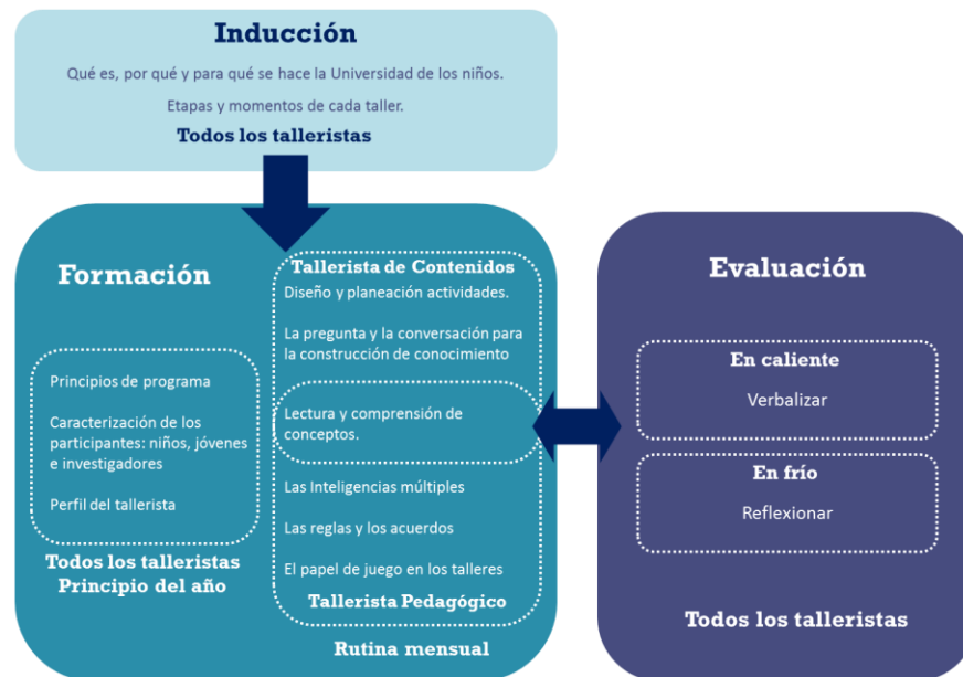
Esquema 3. Formación de talleristas en la Universidad de los niños EAFIT

El último momento del proceso formativo es la evaluación , que tiene como propósito documentar el proceso y ejercitar la autoreflexión sobre el rol del tallerista. Para cumplir con estos propósitos hay dos tipos de reuniones: evaluación en caliente, es decir, inmediatamente después de realizar el taller; y evaluación en frío, luego de un mes. En la primera, se dialoga sobre las percepciones en el cumplimiento del rol como guía, sobre su transformación como talleristas y se proponen ideas para adaptar las actividades, es un momento de verbalización. En la segunda, se reflexiona sobre los temas tratados en la evaluación anterior para proponer soluciones a las dificultades encontradas. Es un momento de reflexión y argumentación.