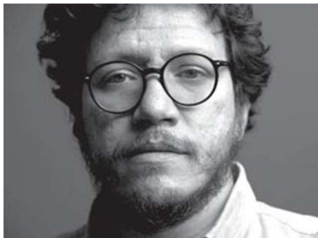
Santiago Gamboa (Bogotá, Colombia 1965) Una casa en Bogotá (Random House).

Su libro más conocido, Rosario Tijeras , fue Premio Dashiell Hammett de la Semana Negra de Gijón en el año 2000.