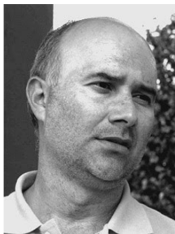
Octavio Escobar Giraldo (Manizales, Colombia 1962)

Con su obra Para un fantasma lejano se hizo acreedor al Premio Nacional de Poesía Misterio de Cultura 1998; y con Imágenes de un viaje ganó el Premio Nacional de Poesía Colcultura, 1993.