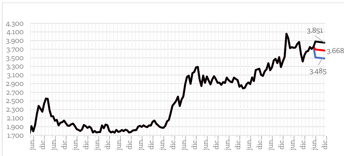
Gráfico 1. Tasa de cambio USD/COP.