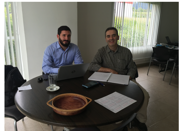
Fase pre VSM en Plásticos Truher